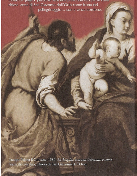
Jacopo Palma il Giovane, 1580. La Vergine con San Giacomo e santi . Sacrestia vecchia, Chiesa di San Giacomo dall'Orio.

L'arco di questo percorso sarà una profonda riscoperta della chiesa stessa di San Giacomo dall'Orio come icona del pellegrinaggio... con e senza bordone.