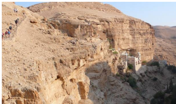
deserto di Giuda: San Giorgio in Coziba