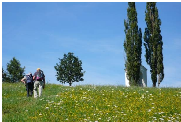
arrivando a Maria Saal