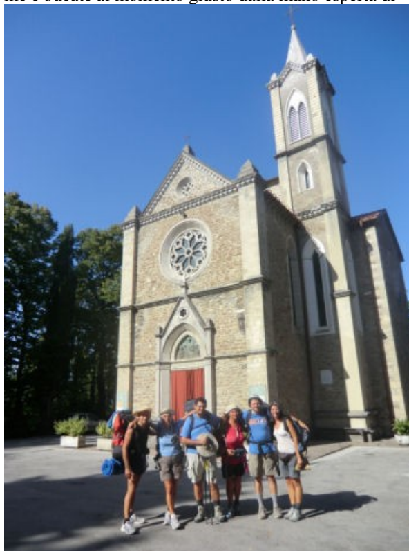
arrivo alla meta di Montepaolo

quando martoriava le spalle, le vesciche (gentili con me e bucate al momento giusto dalla mano esperta di