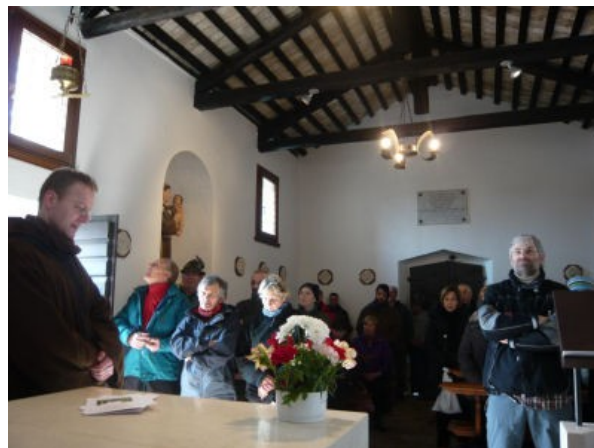
sosta alla chiesa di S. Antonio a Nave