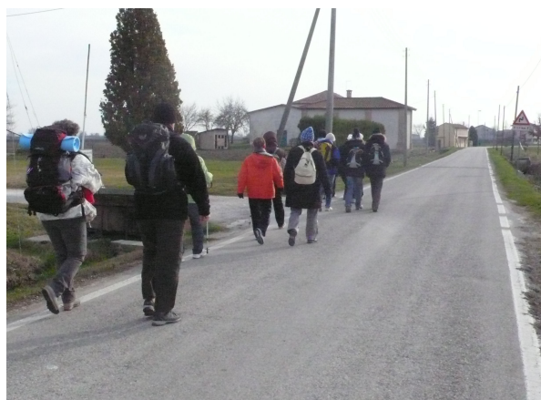
pellegrini da Ponte di Piave a Motta

Prima lezione: mai credersi superiori alla prova.