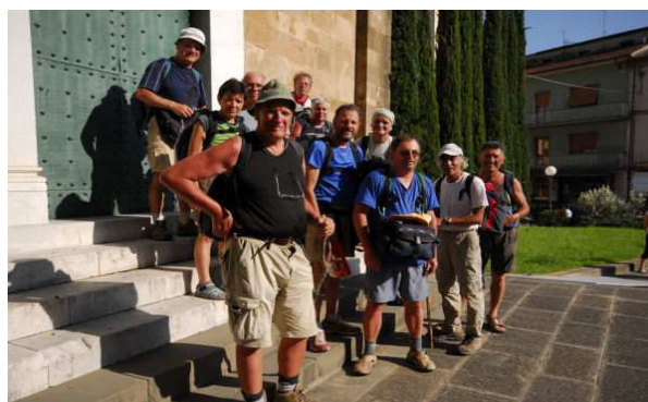
Il gruppo a Altopascio